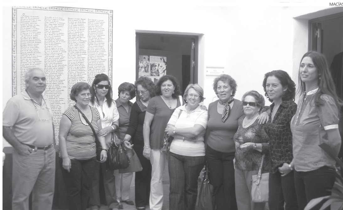
Un grupo de mujeres se fotografió junto a la delegada de Cultura y la guía del museo en la jornada de visita.