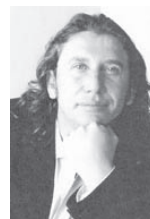
Jorge de Arco

Bajo este atractivo título, Antonio Machón da a la luz un amplio y singular volumen donde realiza una exhaustiva investigación del desarrollo gráfico del niño de 1 a 7 años, basándose en la observación directa de miles de dibujos y en minuciosos análisis de campo.